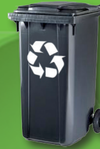
POJEMNIK NA ODPADY ZMIESZANE

Pojemniki a także worki z odpadami zbieranymi selektywnie należy wystawiać przed posesję lub bramę wyznaczonego dnia do godz. 7:00 (w okresie letnim do godz. 6:00), w miejscu dogodnym dla dojazdu samochodu, umożliwiającym ich odbiór przez pracowników. W przypadku stwierdzenia niezgodności zawartości pojemnika z deklaracją, wykonawca usługi zgłasza zaistniały fakt do Urzędu Miejskiego. Przyjazd samochodu z pracownikami i brak możliwości wykonania usługi będzie traktowane tak samo, jakby usługę wykonano.