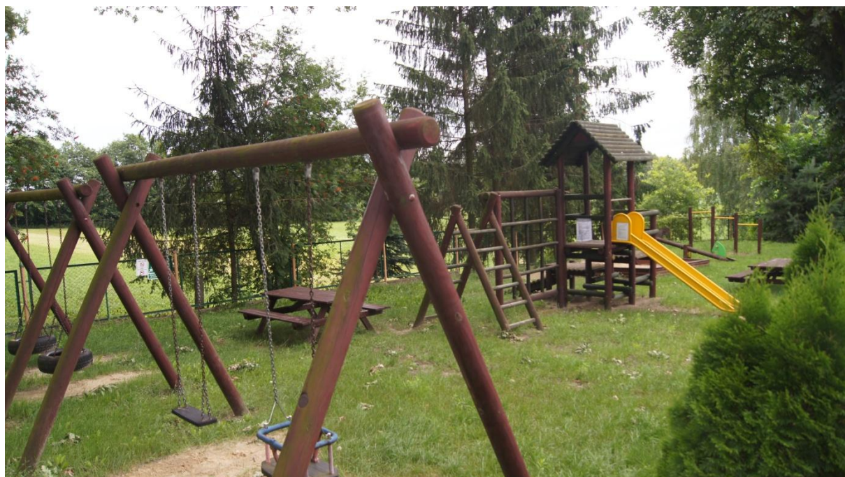
Plac zabaw w Borzyszkowie

Wieś Borzyszkowo leży w odl. 5 km na południowy zachód od Więcborka. Pierwsza wzmianka pochodzi z 1430r. Wieś była własnością szlachecką, należącą do majątku ziemskiego Runowo. W latach zaboru pruskiego i potem – do 1938r. należała do powiatu wyrzyskiego. Od wschodu do wsi przylega niewielkie jezioro Głęboczek Mały. Obrzeżem zachodnim biegnie zaś lina kolejowa Nakło-Chojnice. Z dawnej zabudowy zachowały się dwa budynki z początku XX w. Borzyszkowo jest siedzibą sołectwa, należy do niego również dawny folwark i osada Klarynowo.