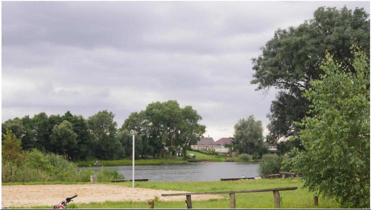
Plaża w Czarmuniu