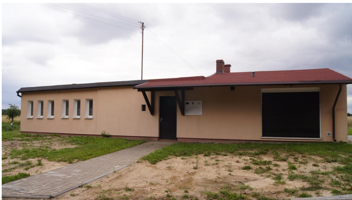
Świątelnia wiejska w Czarmuniu.

Wieś Czarmuń leży w odl. około 9 km na południowy zachód od Więcborka. Pierwsza wzmianka o niej pochodzi z roku 1430. Wieś była własnością szlachecką – w wiekach XVII-XVIII należała do właścicieli majątku Runowo. Z dawnych czasów zachowały się pozostałości dworu z XVIII w. Niewątpliwą atrakcją wsi i sołectwa jest położenie – nad dwoma jeziorami: Czarmuńskim i Głębocek Duży oraz malownicze tereny o urozmaiconej rzeźbie, częściowo porośnięte lasami. Czarmuń od 1954 roku znajduje się w granicach powiatu sępoleńskiego. Jest siedzibą sołectwa.