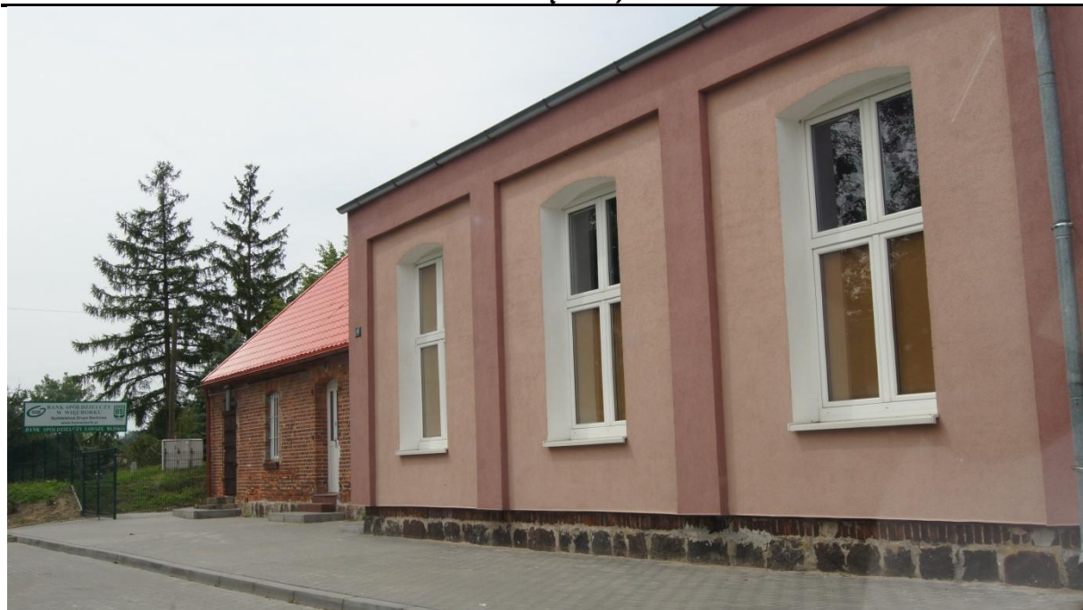
Świetlica wiejska w Jastrzębcu