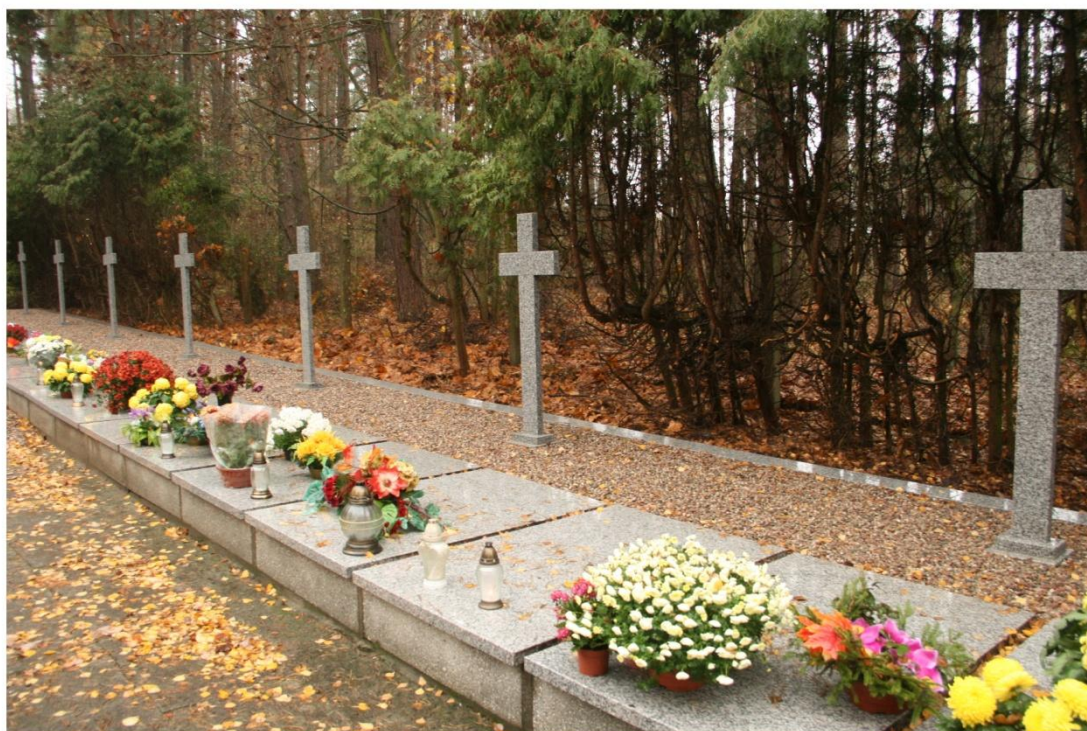
Miejsce Pamięci Narodowej w Karolewie

upamiętniono je cmentarzem-miejscem pamięci narodowej z kaplicą oraz tablicą pamiątkową na ścianie dworu. Corocznie, we wrześniu, odbywają się w tym miejscu okolicznościowe msze św. Dawny folwark po 1945r. został przejęty przez skarb państwa i utworzono tu PGR, który funkcjonował do początku lat 90-tych ub. wieku. Obecnie jest własnością Agencji Nieruchomości Rolnych SP, która oddała grunty i budynki w dzierżawę. Z dawnych budowli zachował się dwór, który przebudowany po wojnie, utracił wartość zabytkową; drewniana stodoła i jeden z budynków mieszkalnych dawnej osady folwarcznej. Karolewo należy do sołectwa Jastrzębiec.