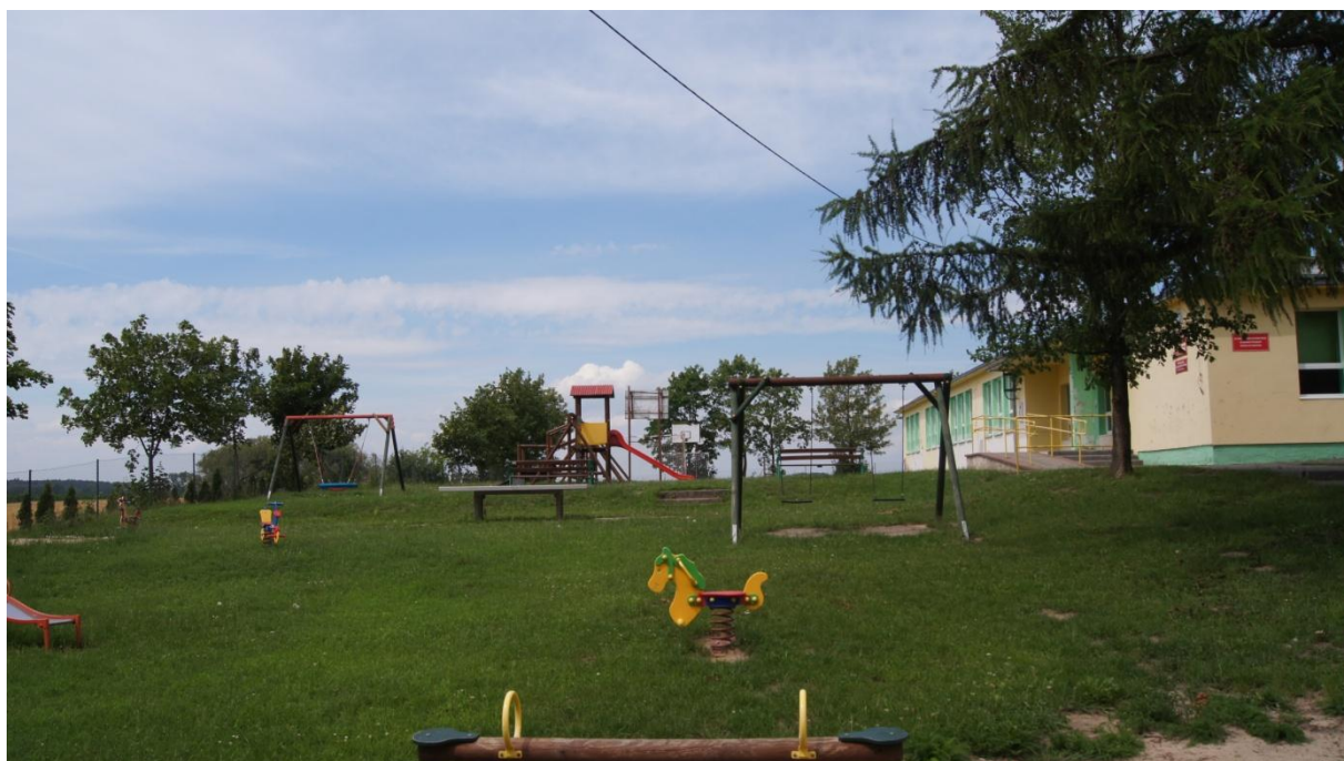
Plac zabaw i Zespół Szkół w Jastrzębcu