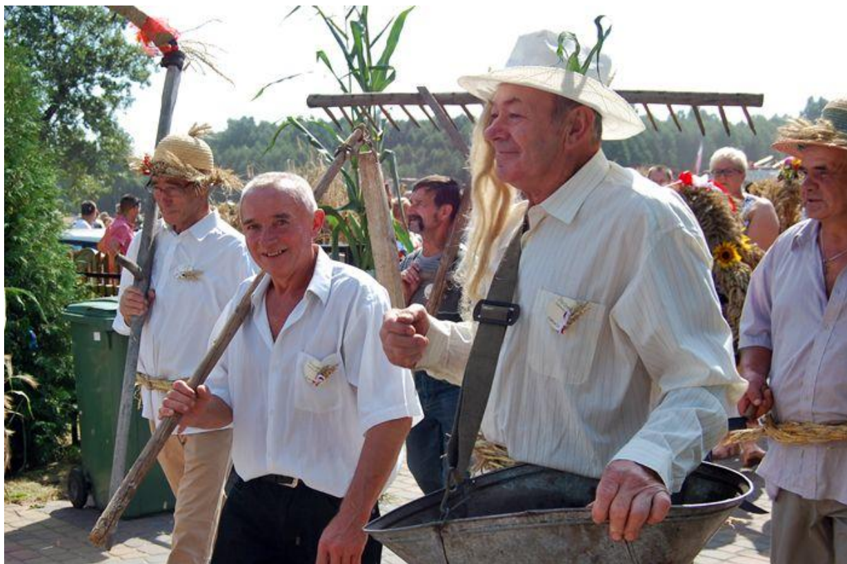
Dożynki w Lubczy.