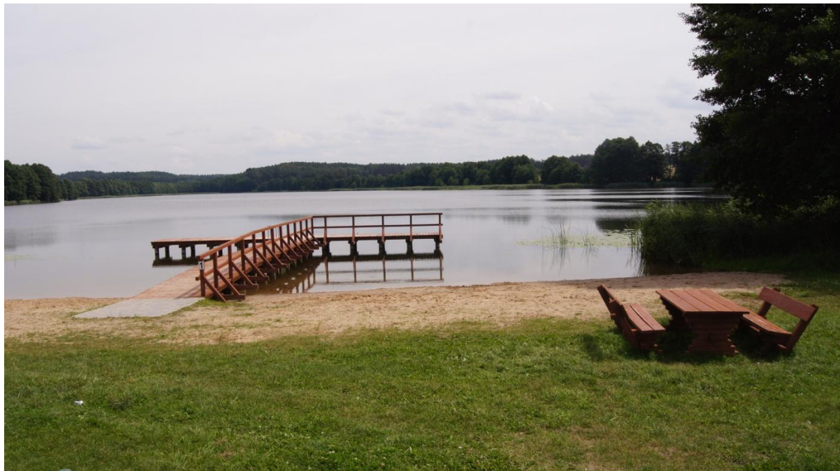
Pomost na Jeziorze Śmiłowskim.