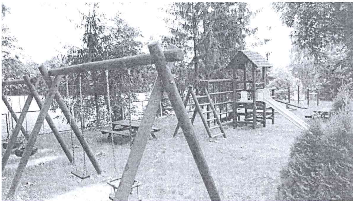
Plac zabaw w Borzyszkowie

Wieś Borzyszkowo leży w odl. 5 km na południowy zachód od Więcborka. Pierwsza wzmianka pochodzi z 1430r. Wieś była własnością szlachecką, należąca do majątku ziemskiego Runowo. W latach zaboru pruskiego i potem – do 1938r. należała do powiatu wyrzyskiego. Od wschodu do wsi przylega niewielkie jezioro Głęboczek Mały. Obrzeżem zachodnim biegnie zaś linia kolejowa Nakło-Chojnice. Z dawnej zabudowy zachowały się dwa budynki z początku XX w. Borzyszkowo jest siedzibą sołectwa, należy do niego również dawny folwark i osada Klarynowo.