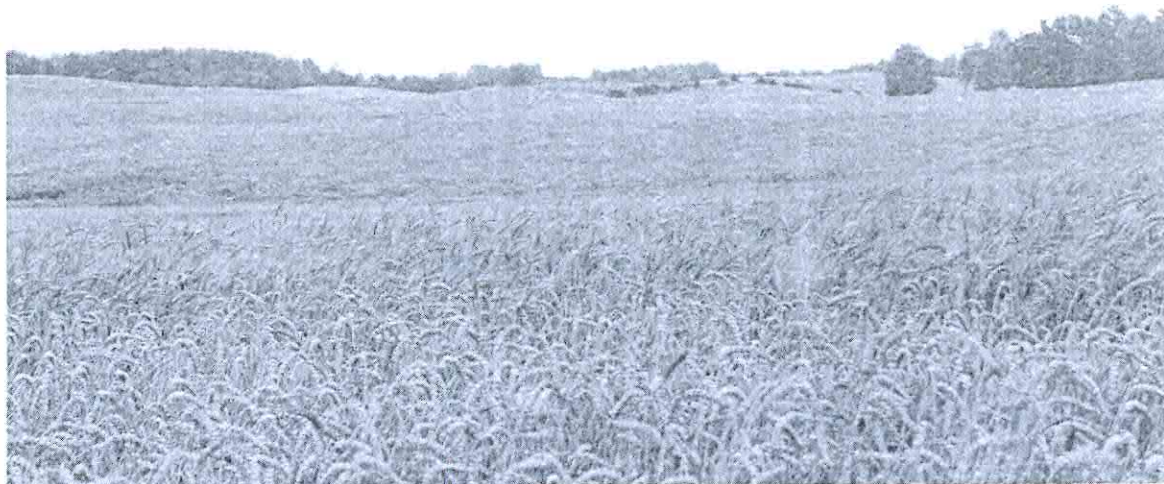
Pola w Górowatkach