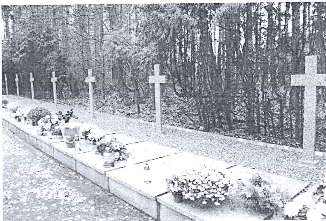
Miejsce Pamięci Narodowej w Karolewie

upamiętniono je cmentarzem-miejsmem pamięci narodowej z kaplicą oraz tablicą pamiątkową na ścianie dworu. Corocznie, we wrześniu, odbywają się w tym miejscu okolicznościowe msze św. Dawny folwark po 1945r. został przejęty przez skarb państwa i utworzono tu PGR, który funkcjonował do początku lat 90-tych ub. wieku. Obecnie jest własnością Agencji Nieruchomości Rolnych SP, która oddała grunty i budynki w dzierżawę. Z dawnych budowli zachował się dwór, który przebudowany po wojnie, utracił wartość zabytkową; drewniana stodoła i jeden z budynków mieszkalnych dawnej osady folwarcznej. Karolewo należy do sołectwa Jastrzębiec.