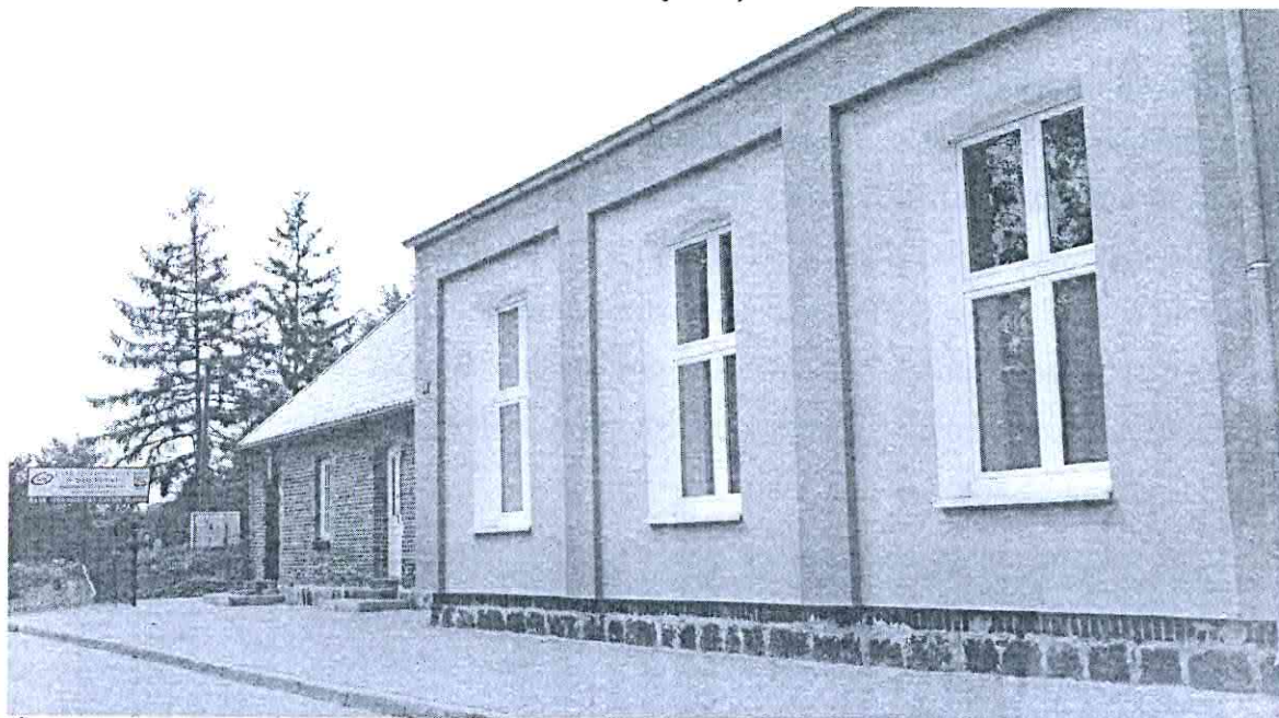
Świetlica wiejska w Jastrzębcu