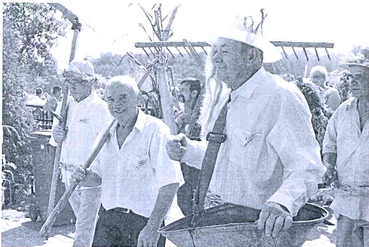
Dożynki w Lubczy.