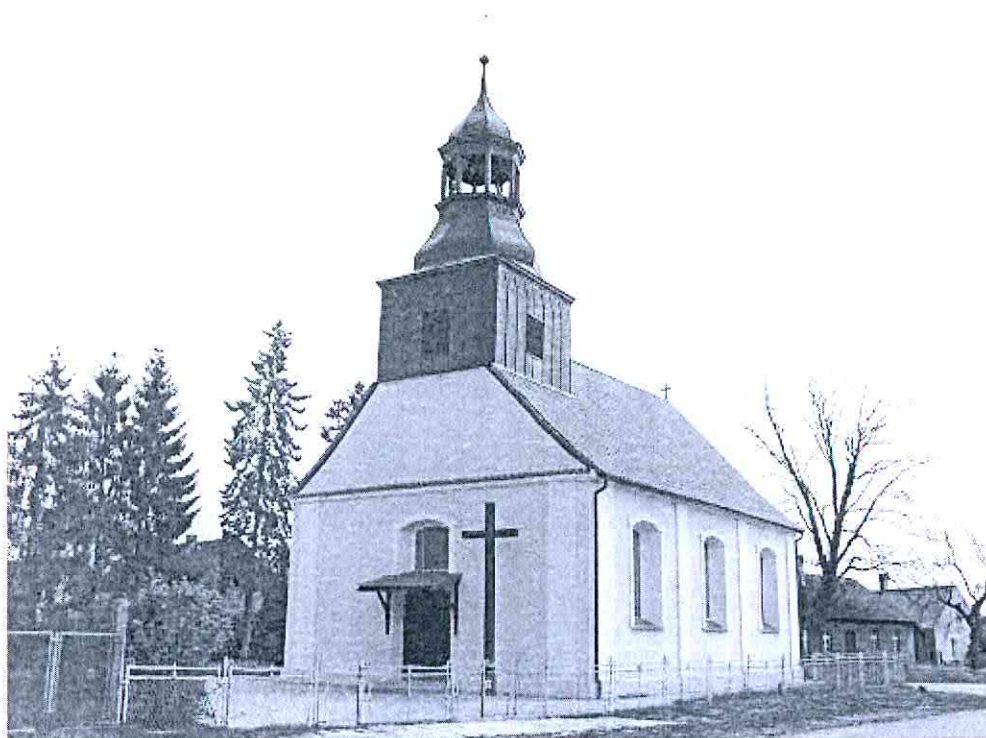
Kościół Ewangelicki obecnie parafialny rzymsko – katolicki p.w. św. Maksymiliana Kolbe w Pęperzynie