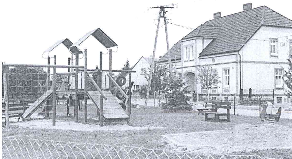
Plac zabaw i budynek świetlicy wiejskiej.