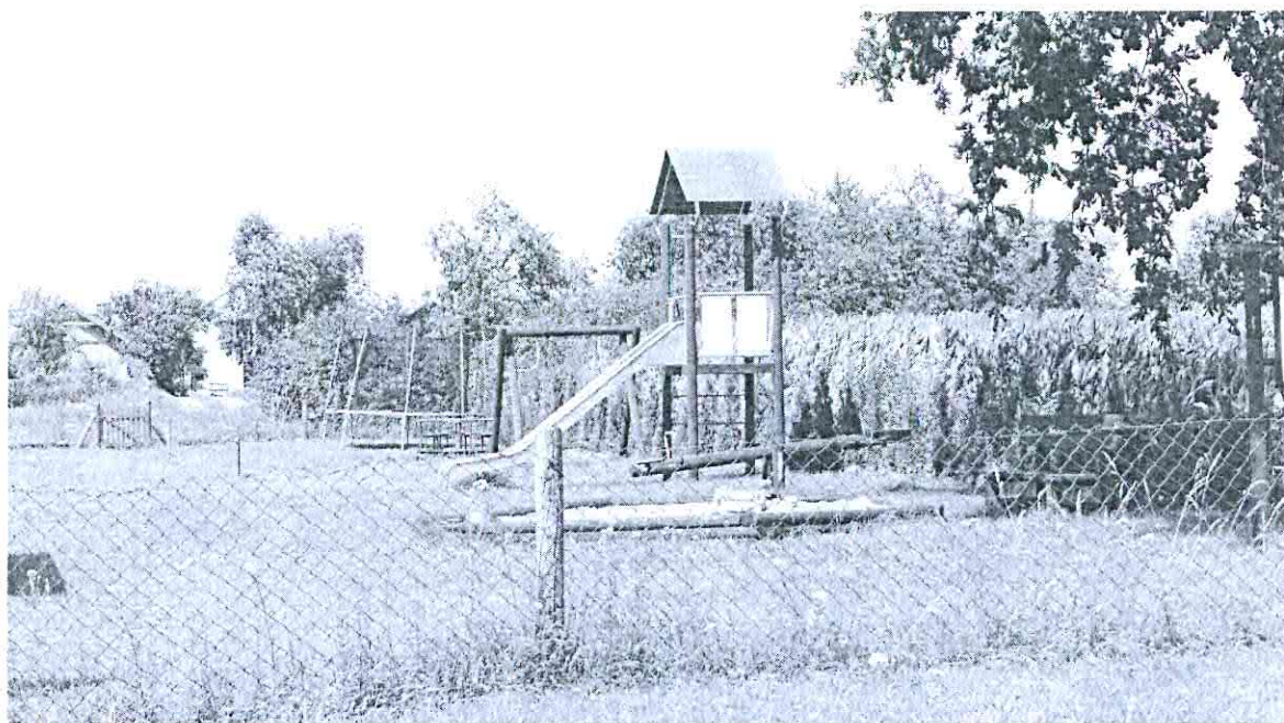
Plac zabaw w miejscowości Zgniłka.