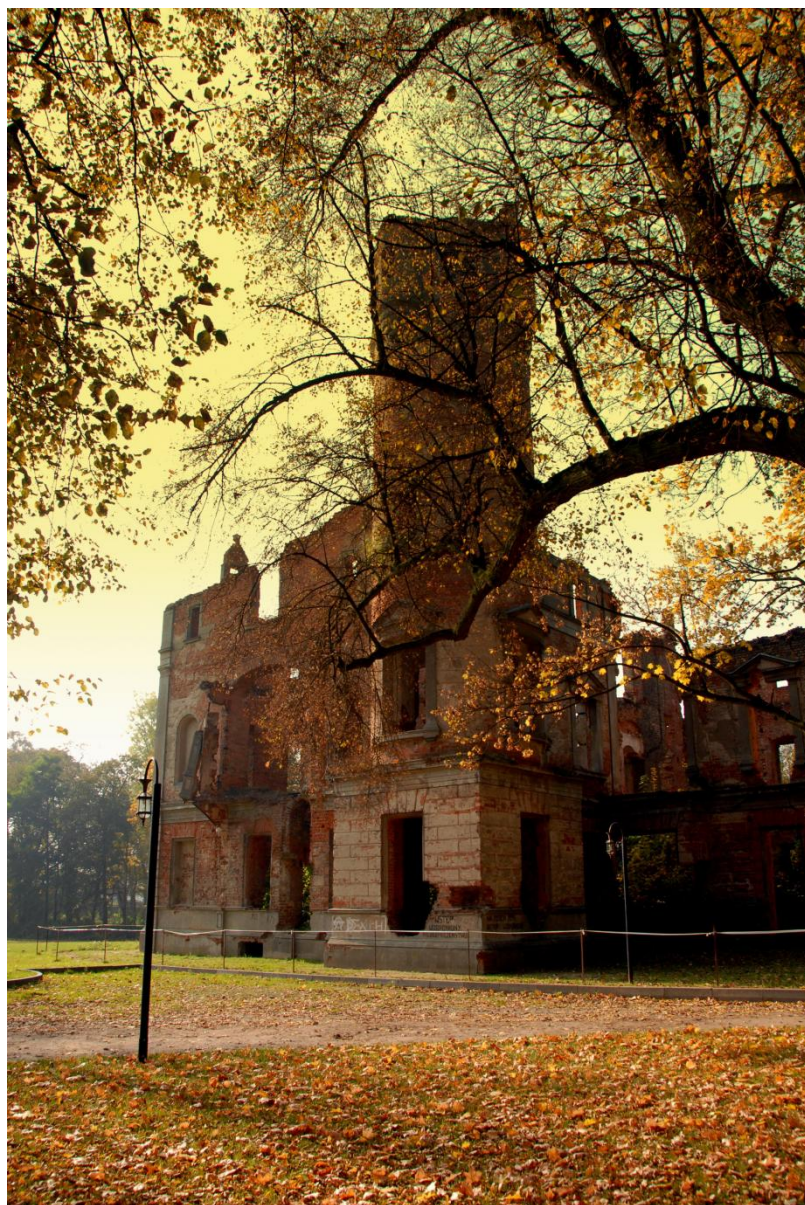
Ruiny Pałacu Orzelskich