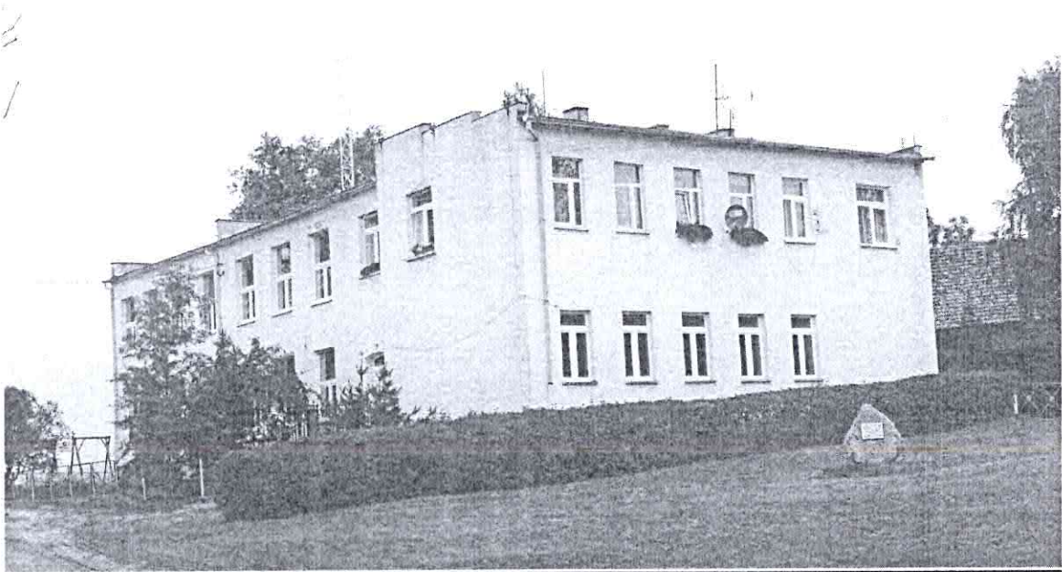
Szkoła Podstawowa w Zakrzewku

Wieś Zakrzewek leży w odl. 4,5 km na północny zachód od Więcborka. Pierwsza wzmianka pochodzi z 1453r. W okresie staropolskim i później – do 1821r. był tu folwark należący do dóbr więcborskich. Został całkowicie rozparcelowany do połowy XIXw. pomiędzy głównie osadników niemieckich. Wieś jest malowniczo położona nad niewielkim jeziorem o nazwie Koźlinek. Znajduje się tu szkoła podstawowa, remiza OSP, świetlica wiejska oraz sklep spożywczo-przemysłowy. Większość dawniejszych budynków została przebudowana lub gruntownie odnowiona w ostatnich kilkunastu latach, tak że dziś nie posiadają one już cech zabytkowych. Wieś jest samodzielnym sołectwem.