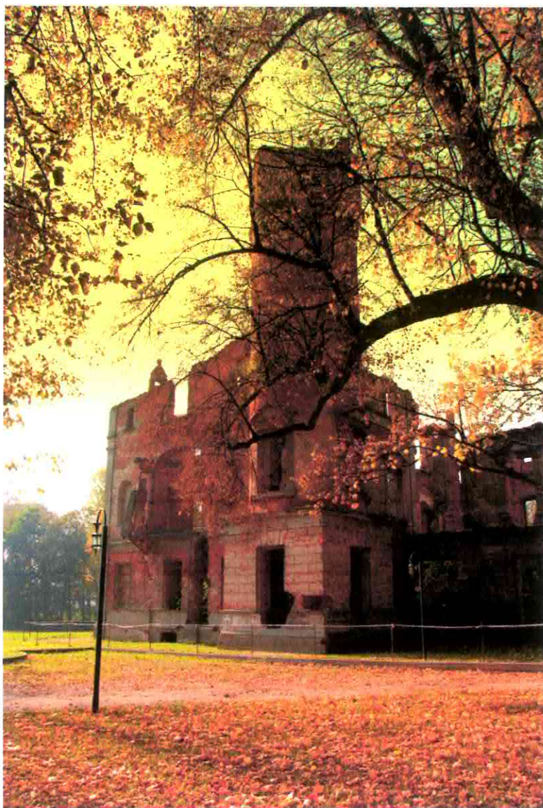
Ruiny Pałacu Orzelskich