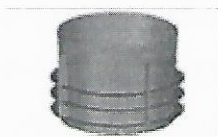
Pierścień wznosny bez odpływu. H-255mm

Do wykonanego przewodu kanalizacji deszczowej włączyć wpusty uliczne z tworzywa sztucznego. Na kompletny wpust uliczny składa się krata żeliwna C-250 z zawiasami, z ryflem wg PN-EN-124. Wpust uliczny składa się z kinety bez odpływu, kinety z odpływem KG \varnothing 160 , pierścienia wznosnego bez odpływu, pierścienia, wznosnego z odpływem KG-DN-160, pierścienia odciążającego, pierścienia uszczelniającego i włazu z tworzywa sztucznego. Elementy składowe projektowanych wpustów ulicznych pokazano poniżej.