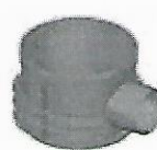
Kineta bez odpływu H-470mm