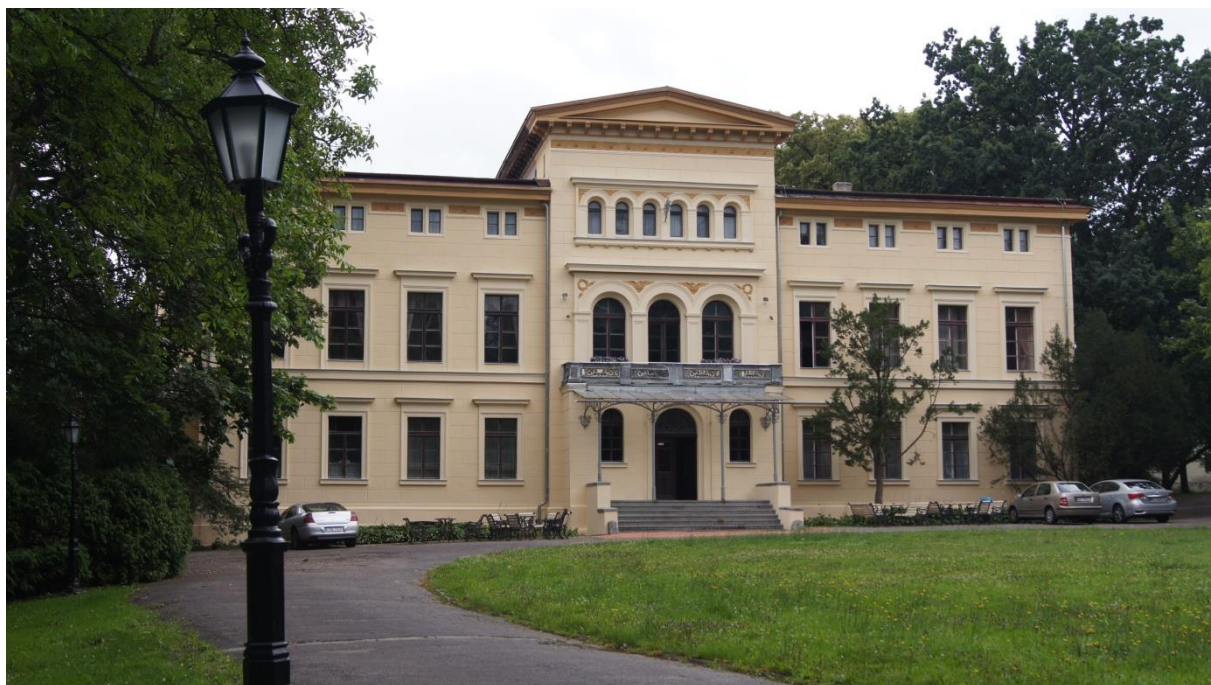
Pałac w Sypniewie