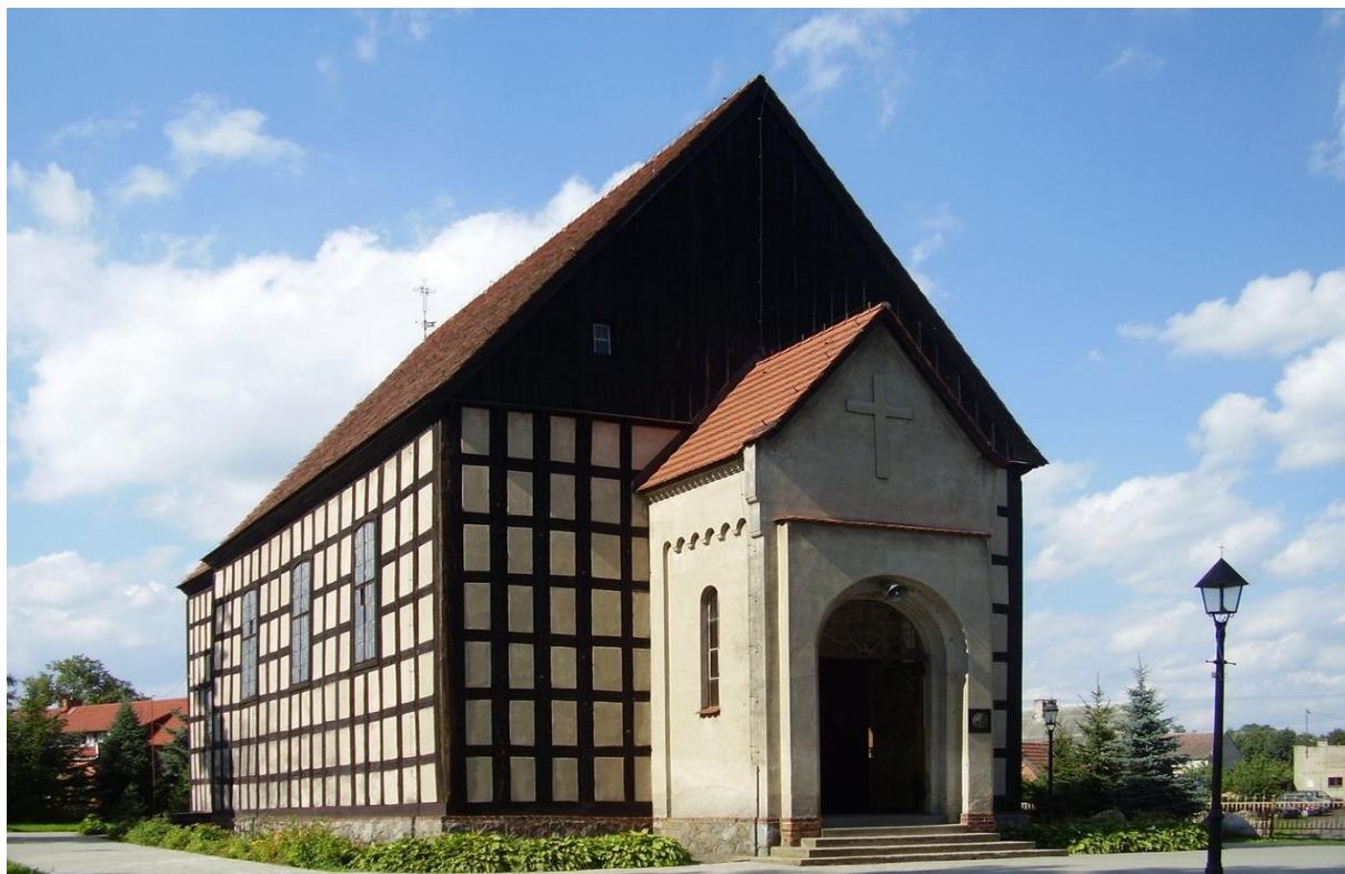
Kościół p.w. Świętej Katarzyny