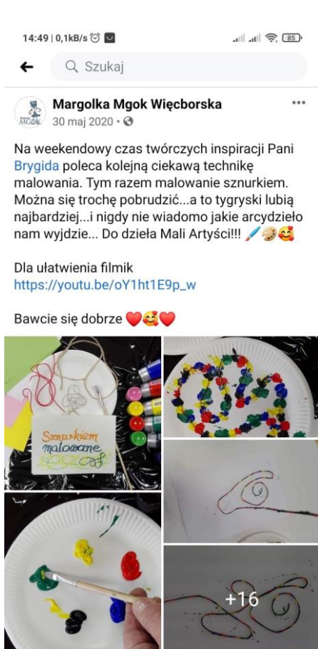
Zajęcia plastyczne Brygidy Fertykowskiej – wpis na FB