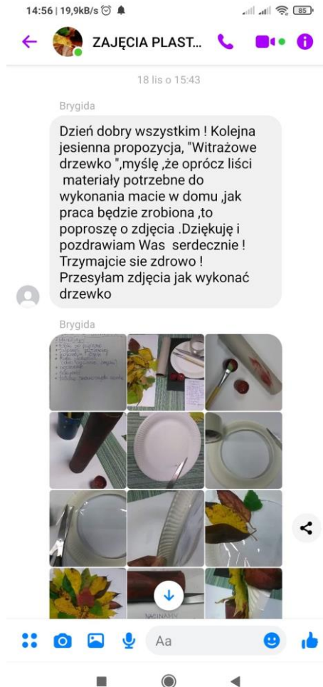
zajęcia na grupie Messenger.