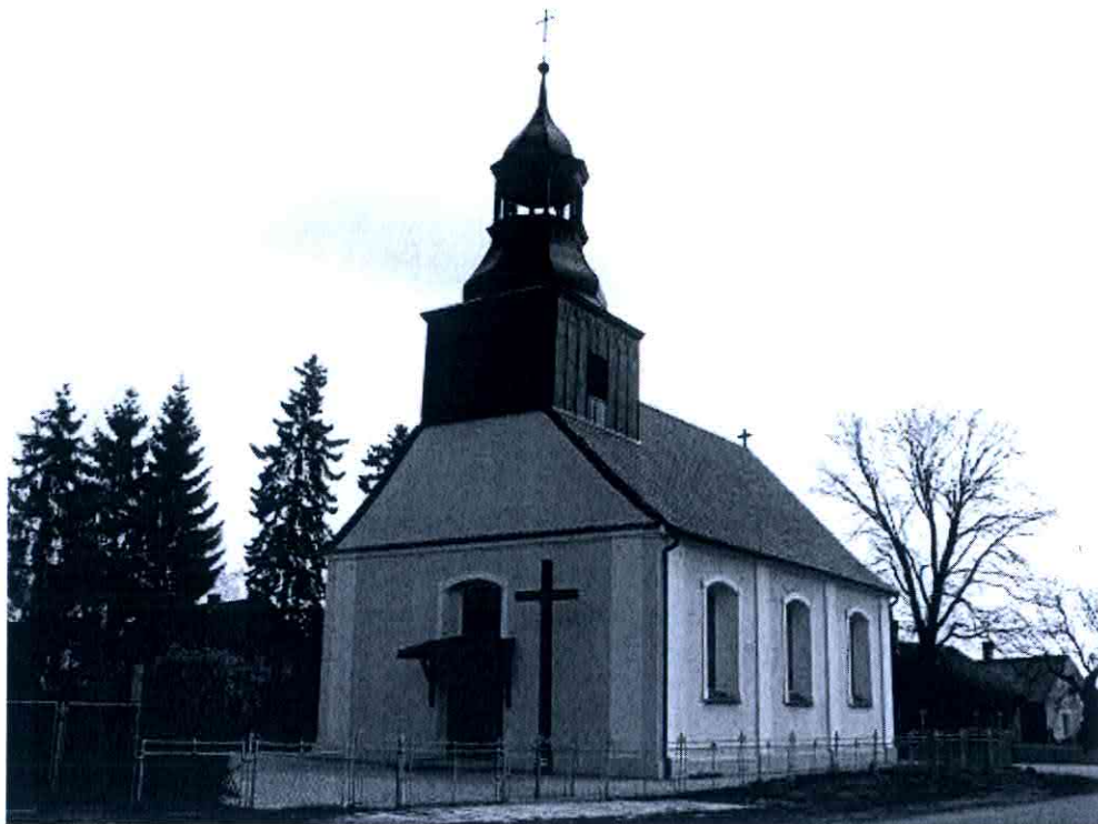
Kościół Ewangelicki obecnie parafialny rzymsko – katolicki p.w. św. Maksymiliana Kolbe w Peperzynie