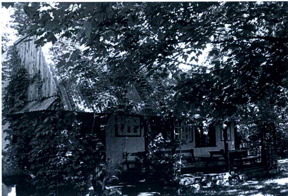
Skansen „Pasieka Krajeńska”