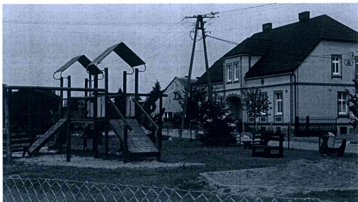
Plac zabaw i budynek świetlicy wiejskiej.