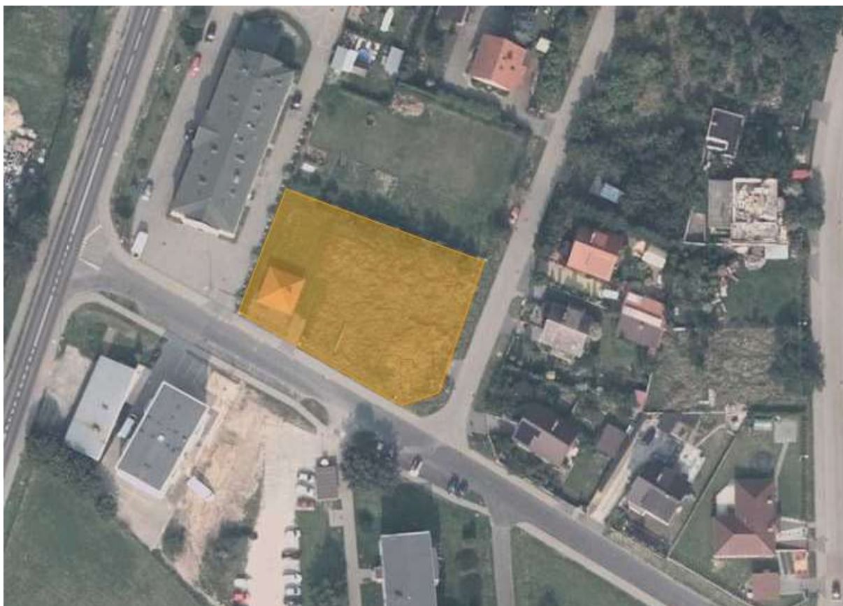
Charakter zagospodarowania analizowanego terenu

Analizowany obszar obejmuje swym zasięgiem obszar działki ewidencyjnej nr 314/5 o powierzchni około 0,1742 ha, zlokalizowanej przy ulicy Krajeńskiej (droga gminna). Aktualnie zabudowa w postaci budynku usługowego znajduje się wyłącznie w części południowo-zachodniej, pozostałą część terenu stanowią nieużytki.