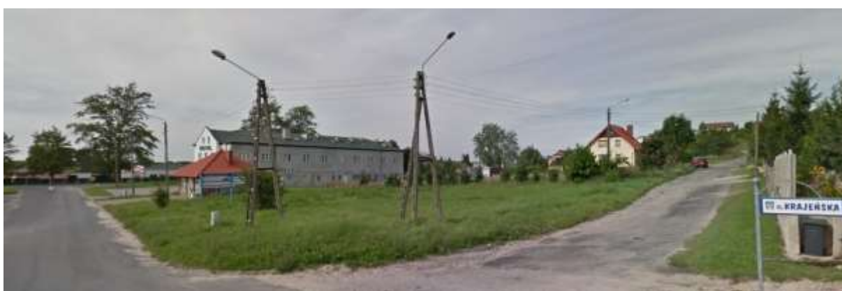
Widok z ulicy Krajeńskiej na teren działki nr 314/5

Analizowany teren znajduje się bliskiej odległości (około 0,24 km), Krajeńskiego Parku Krajobrazowego, obowiązuje Uchwała nr XLII/717/18 Sejmiku Województwa Kujawsko-Pomorskiego z dnia 19 marca 2018 r. zmieniająca uchwałę w sprawie Krajeńskiego Parku Krajobrazowego (Dz. Urz. z 2018 r., poz. 1477). Szczególnym celem ochrony Parku jest ochrona centralnej części regionu Pojezierza Krajeńskiego ze względu na wartości przyrodnicze, historyczne i kulturowe oraz walory krajobrazowe w celu zachowania i popularyzacji tych wartości w warunkach zrównoważonego rozwoju. Tereny leśne parku przedstawiają duże zróżnicowanie roślinności, co jest związane z bogactwem form rzeźby terenu. W runie leśnym, na bagnach i torfowiskach napotkać można liczne stanowiska roślin chronionych i rzadkich. Licznie występuje zwierzyna łowna. Z gatunków chronionych do najciekawszych należą: bocian czarny, żuraw, czapla, łabędź, rybołów bielik i cietrzewie, a spośród ssaków: wydry, bobry oraz rzadziej spotykane łosie. Z gadów i płazów spotkać można: jaszczurki, zaskrońce, padalce, żmije i żaby.