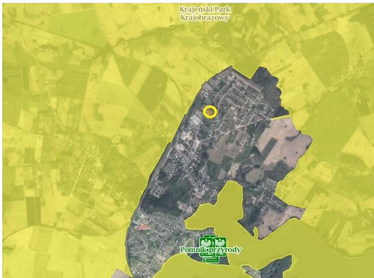
Analizowany obszar na tle obszarów chronionych przyrodniczo

Zgodnie z mapą korytarzy ekologicznych w Polsce ( http://mapa.korytarze.pl/ ) przez teren obszaru opracowania nie przebiega żaden korytarz ekologiczny. Najbliższy korytarz ekologiczny, znajduje się w odległości ok. 1,70 km na północ od granic analizowanego obszaru jest to korytarz ekologiczny KPn-17B Krajna.