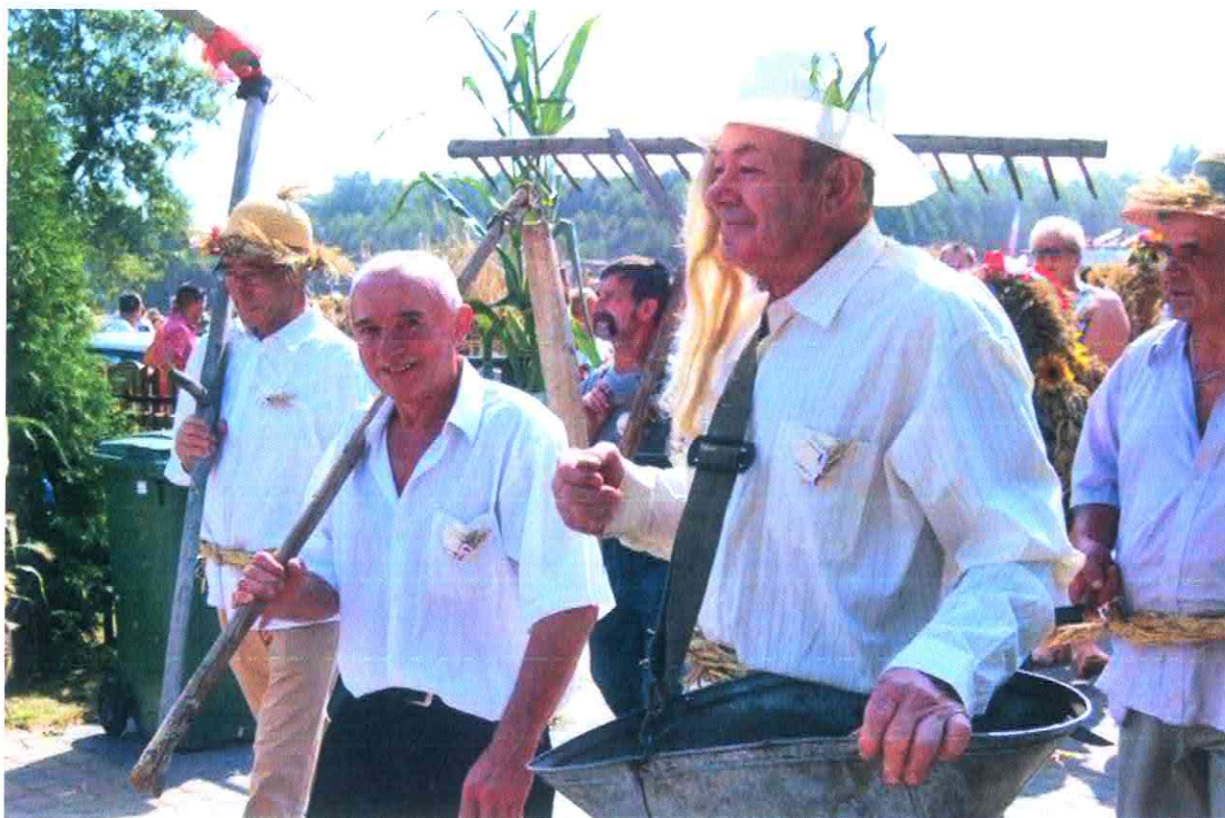
Dożynki w Lubczy.