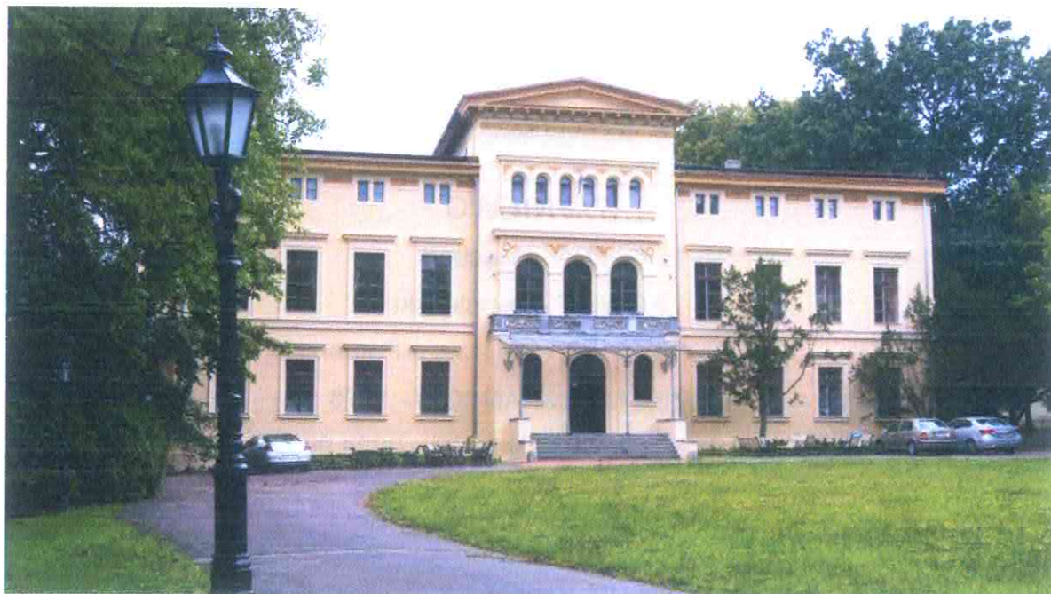
Pałac w Sypniewie