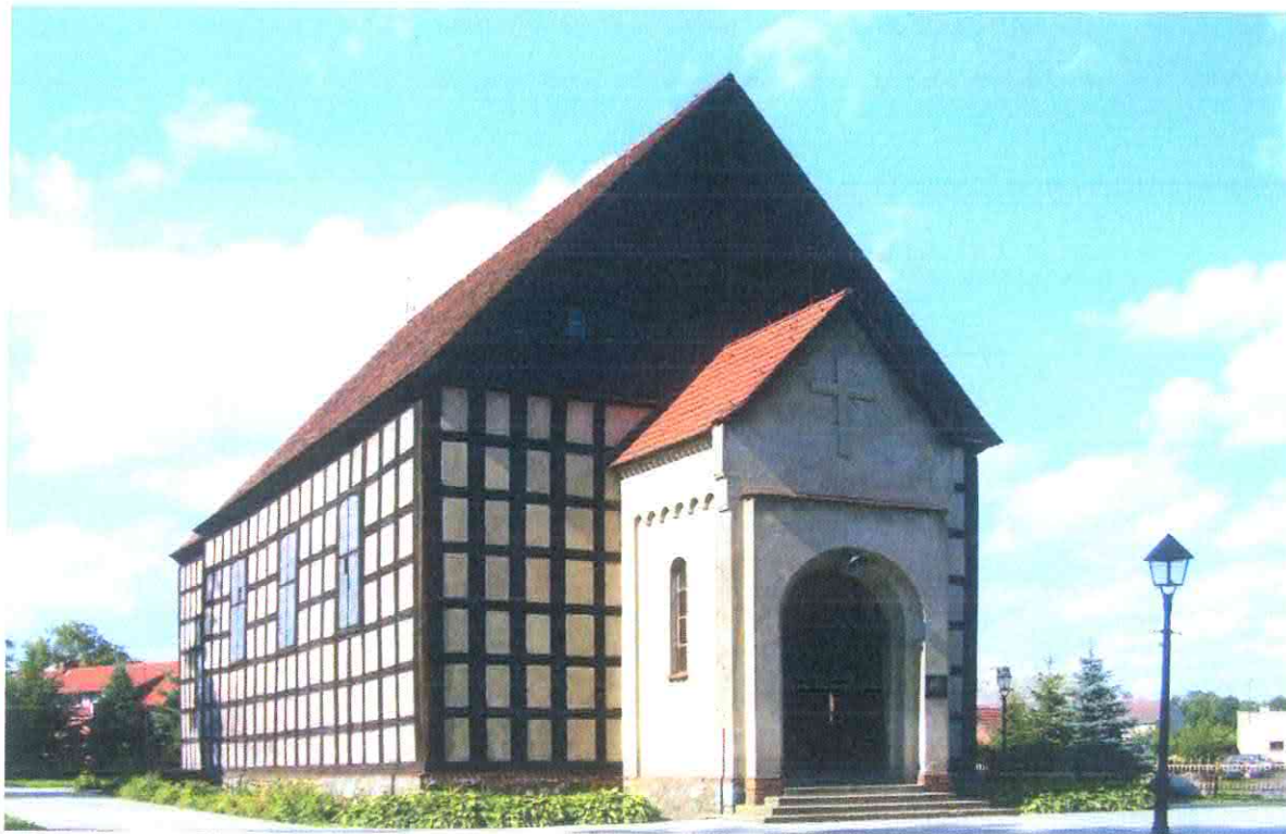
Kościół p.w. Świętej Katarzyny