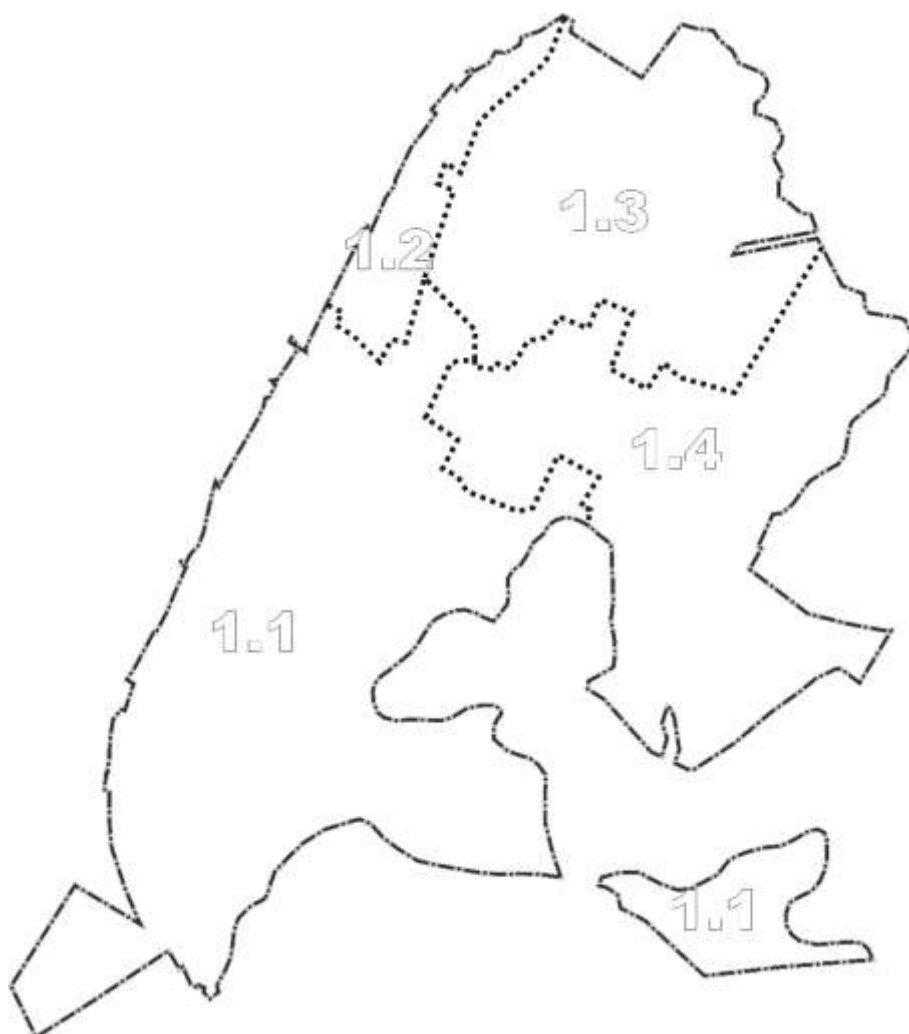
Rysunek. Podział miasta na jednostki polityki przestrzennej